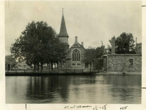
Musée de société des Deux-Rives- collection MUSO

Cette tournée, qui mettra en lumière l'histoire, la richesse patrimoniale, architecturale et spirituelle de notre milieu se termine par la visite de l'église du restaurant le 57 sur la rue Dufferin, une autre église patrimoniale de notre ville.